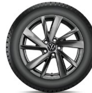
VW Gavia Adamantium Dark