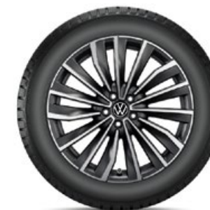
VW Seoul Dark Graphite Matt