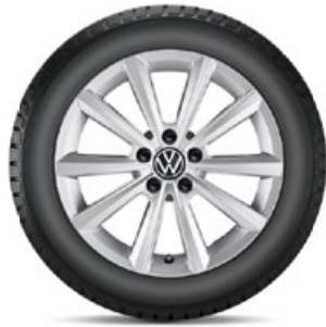
VW Merano Silber