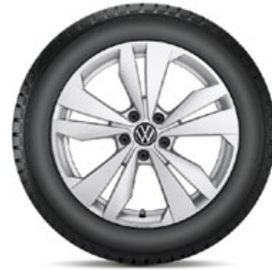
VW Loen Silber