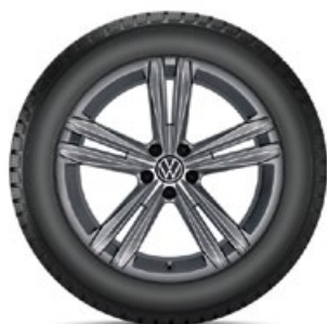
VW Sebring Grau