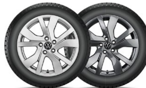
VW Rockingham Silber

VW Huntsville Silber für den neuen Tiguan in 19" mit 235/50 R19 103V XL Bridgestone Blizzak LM005 statt 3.600,- mit TopCard 2.700,- KE: C | NHK: A | GE: 72 | GE/G: B | SK-F: Nein Art.-Nr. 2355019HV40005