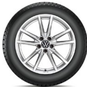
VW Pretoria Silber

VW Bergamo Schwarz für den Golf 8 in 18" mit 225/40 R18 92V XL Conti WinterContact TS 870 P statt 3.080,- mit TopCard 2.310,- KE: C | NHK: B | GE: 71 | GE/G: B | SK-F: Nein Art.-Nr. 5H007328AX1S