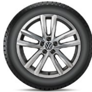
VW Pamplona Grau