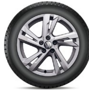
VW Valencia Grau