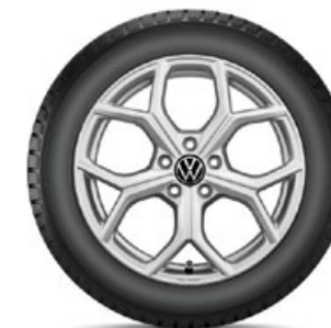
VW Huntsville Silber

Alle abgebildeten Winterkomplettäder (WKR) für den neuen Tiguan haben keine Reifendruckkontroll-Sensoren (RDKS). Falls Ihre Fahrzeugausstattung dies erfordert, sind WKR mit RDKS zu wählen. Beachten Sie bitte den Aufpreis. Ihr Volkswagen Service-Betrieb informiert Sie gerne.