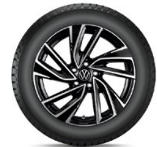
VW Adelaide Schwarz

VW Gavia Silber für den neuen Passat in 16" mit 215/60 R16 95H RDKS 1 Conti WinterContact TS 870 P ContiSeal statt 2.240,- mit TopCard 1.680,- KE: C | NHK: B | GE: 70 | GE/G: B | SK-F: Ja Art.-Nr. 3J0073268Z8SR