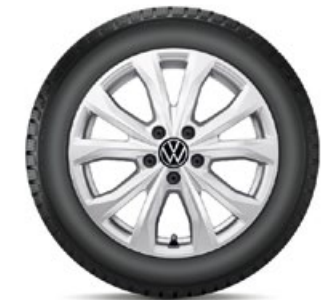
VW Barahona Silber

KE = Kraftstoffeffizienz, NHK = Nasshaftungsklasse (Rollwiderstand), GE = Geräuschemission (Abrollgeräusch), GE/G = Geräuschemission Gruppe, SK-F = Schneekettenfreigabe.