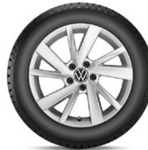
VW Gavia Silber