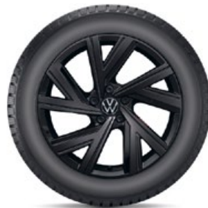
VW Bergamo Schwarz

Über detaillierte Informationen zu den Fahrzeugverwendungen, Einschränkungen und Auflagen informieren wir Sie gerne. KE = Kraftstoffeffizienz, NHK = Nasshaftungskategorie (Rollwiderstand), GE = Geräuschemission (Abrollgeräusch), GE/G = Geräuschemission Gruppe, SK-F = Schneekettenfreigabe.