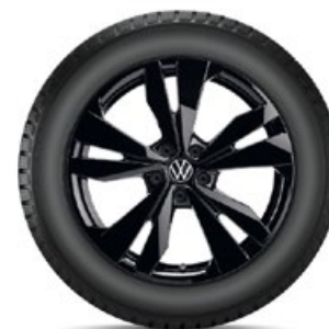
VW Loen Schwarz