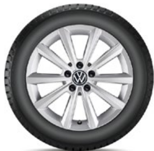
VW Merano Silber

Alle Preise auf dieser Seite sind unverb., nicht kart. Richtpreise in Euro inkl. MwSt. exkl. Einbau/Montage.