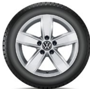
VW Corvara Silber