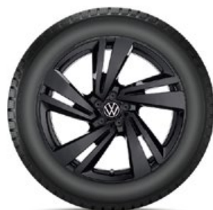
VW Nevada Schwarz

Alle Preise auf dieser Seite sind unverb., nicht kart. Richtpreise in Euro inkl. MwSt. exkl. Einbau/Montage.